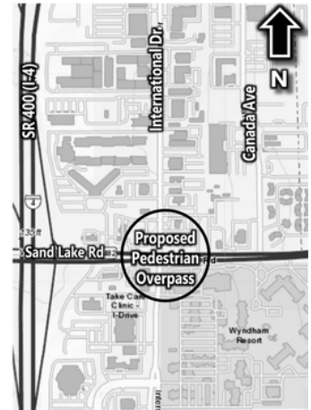
Ubicación del Puente Peatonal

La reunión será el Miércoles, 2 de Agosto de 2023, en Embassy Suites, 8250 Jamaican Court, Orlando, FL 32819 . La jornada de puertas abiertas comenzará a las 5:30 p.m. seguida de una presentación a las 6 p.m. Los mapas e ilustraciones del proyecto estarán disponibles para revisión y comentarios públicos. Los miembros del equipo del proyecto estarán en el sitio para responder preguntas.