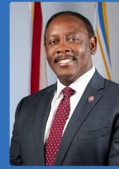
ALCALDE DE ORANGE COUNTY JERRY L. DEMINGS